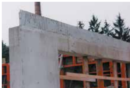
Montage der BEGO®-Platten